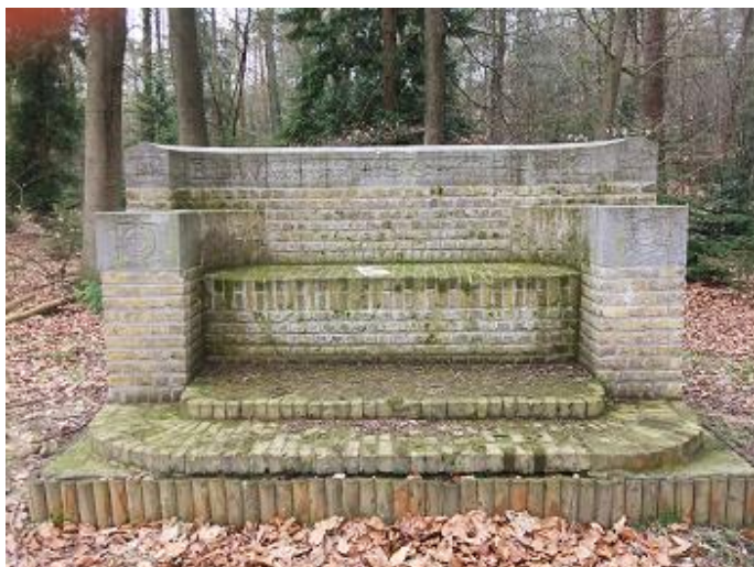
Van der Huchtbank