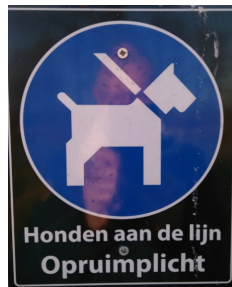
Honden aangelijnd met opruimplicht