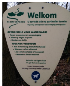
Toegang met hond aangelijnd