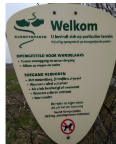
Toegang met hond verboden