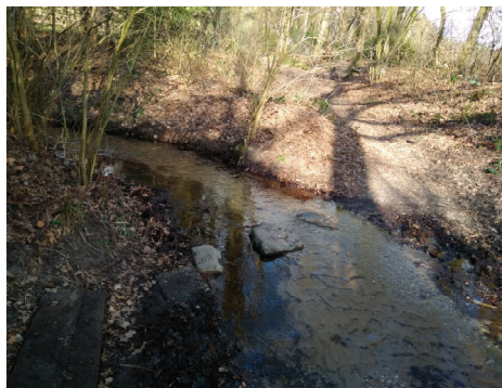
Stapstenen in de Meibeek te Wiesel