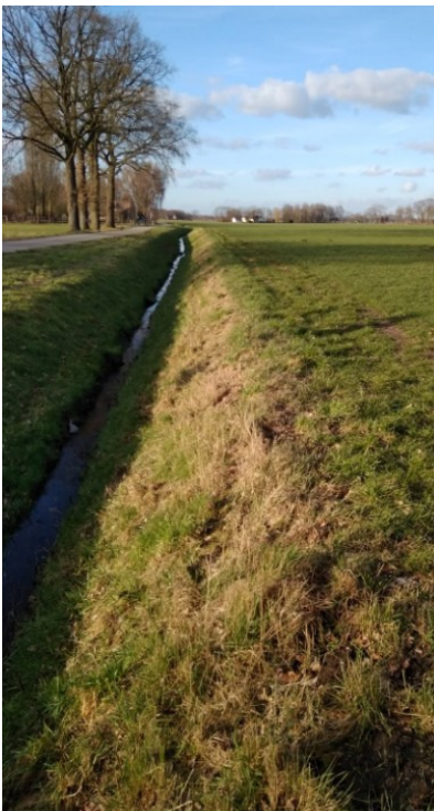
Grote Wetering met Grenspalenpad