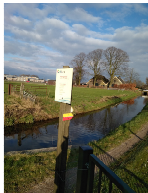
Pad langs Grote wetering