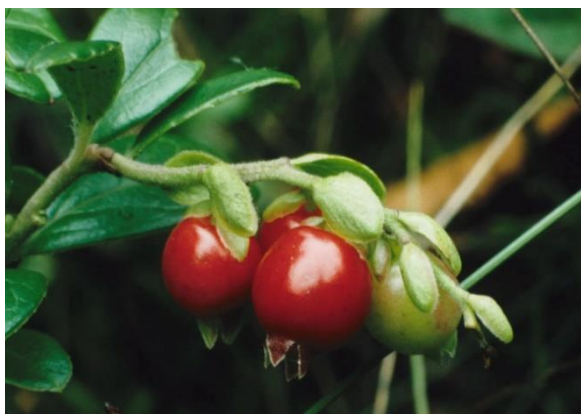
Rode bosbes of vossenbes