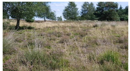
Vergrassing heide door pijpenstrootje