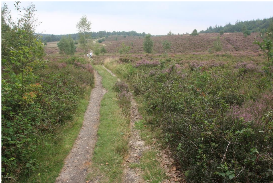
Heidepad over Het Leesten

Betreding door mensen en machines is slecht voor de begroeiing en veroorzaakt erosie. Heide vergt onderhoud, zonder ingrijpen wordt de heide weer bos. Schapen, die in dit deel van de heide binnen de afrastering lopen, helpen bij dit onderhoud. Toch is de heide sterk vergrast door stikstofdepositie uit de lucht. Grassen als pijpenstrootje, groeiend in dikke pollen en bochtige smele met de witte aartjes verdringen hier de heide.