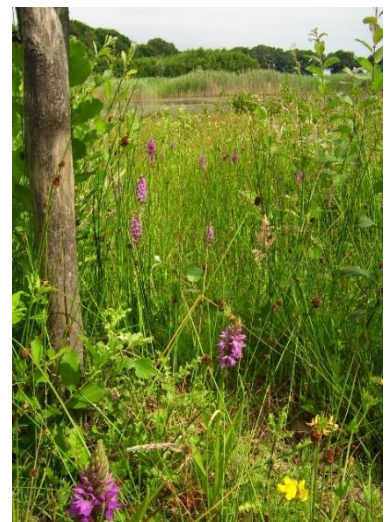
Het Schol in juni

Rechts van het pad ligt een driehoekig perceel. Hier ontwikkelt zich een vegetatie van schraal grasland en vochtige heide. Ook dit voormalige voedselrijke weiland wordt jaarlijks gemaaid en het maaisel afgevoerd. Juist in dit deel zijn bijzondere plantensoorten gevonden, zoals lage zegge, sterzegge, blauwe zegge en liggend hertshooi. In juni bloeit er de gevlekte orchis.