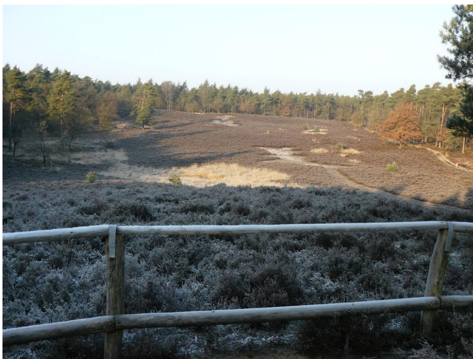
uitzicht vanaf de Schansenberg

Het zand dat hier tegen de heuvel op ligt is het bekijken waard. Pak eens een handje ervan op en zie dat het erg fijn is. Het zand van deze heuvel, de Schansenberg, is hier door de wind gebracht. Zo'n heuvel noemen we een stuifheuvel, het is duidelijk waarom. Boven heeft u een mooi uitzicht over de heide en het (verdrogende) vennetje, dat een zoelplaats voor wilde zwijnen is.