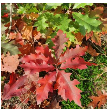
blad Amerikaanse eik

Even verder is alweer een afsluitboom omdat je landgoed De Kooiberg betreedt. Het bordje P links verwijst naar de (zeer beperkte) parkeermogelijkheid voor gebruikers van de NTKC-natuurcamping De Kooiberg, die wat verderop fraai gelegen is in een diep uitgesleten smeltwaterdal uit de laatste ijstijd.