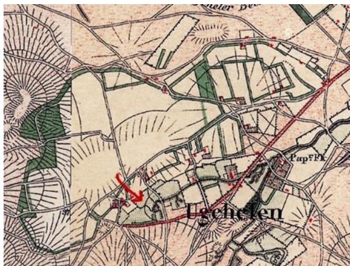
Ugchelse enk 1885