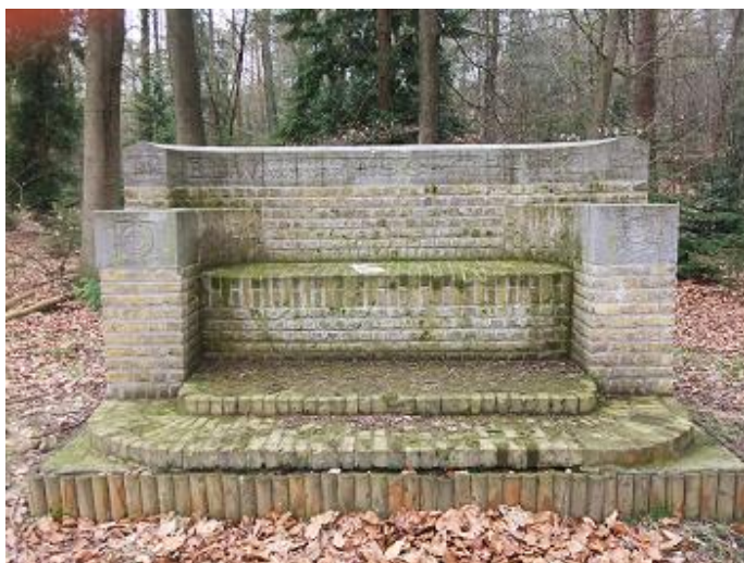
Van der Huchtbank