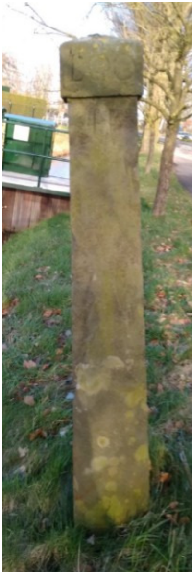
Grenspaal bij de Kar