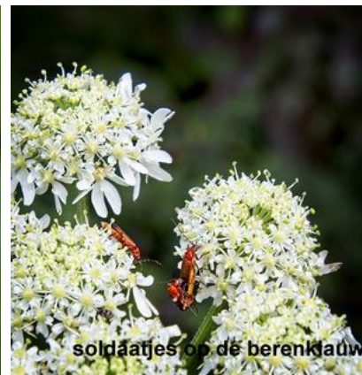
soldaatjes op de berenklauw

Heemtuin de Maten in juli (Janneke Niessen)