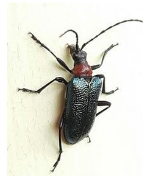
Gaurotes virginea, boktor