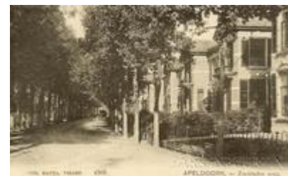
Toenmalige Zwolscheweg circa 1930

Na het overlijden van Hendrikus Mouw in 1911 werden alle huizen verkocht en ze staan er nu nog steeds in volle glorie. (Bron: www.parkenbuurt.nl).