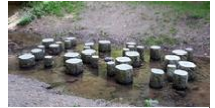
Stapstenen. Kun je naar de overkant door op elke steen 1x te gaan staan?

In de afgelopen 25 jaar zijn alle vervuilingbronnen opgeheven. De Grift is nu weer zo schoon dat het beekstelsel weer een belangrijke ecologische verbindingszone is voor waterdieren.