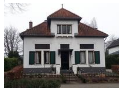
Koninginnelaan 45 - 51