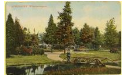
Wilhelminapark ca 1920

Verderop in het park links het Monument Tutein Nolthenius . Henri Paul Jules Tutein Nolthenius was burgemeester van Vlissingen en later van Apeldoorn. Hij beschermde de kunst en het ambacht. Dit monument werd als eerbetoon van de Apeldoornse en Vlissingse burgerij onthuld op 9 maart 1932.